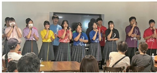
市立高田商業高校アカペラ部

当女性会では、今後も色々な趣向をこらした催しを通して、皆さまに喜んで頂けるよう日々努力して参りますので宜しくご支援のほどお願い申し上げます。