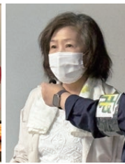
岡本会長あいさつ